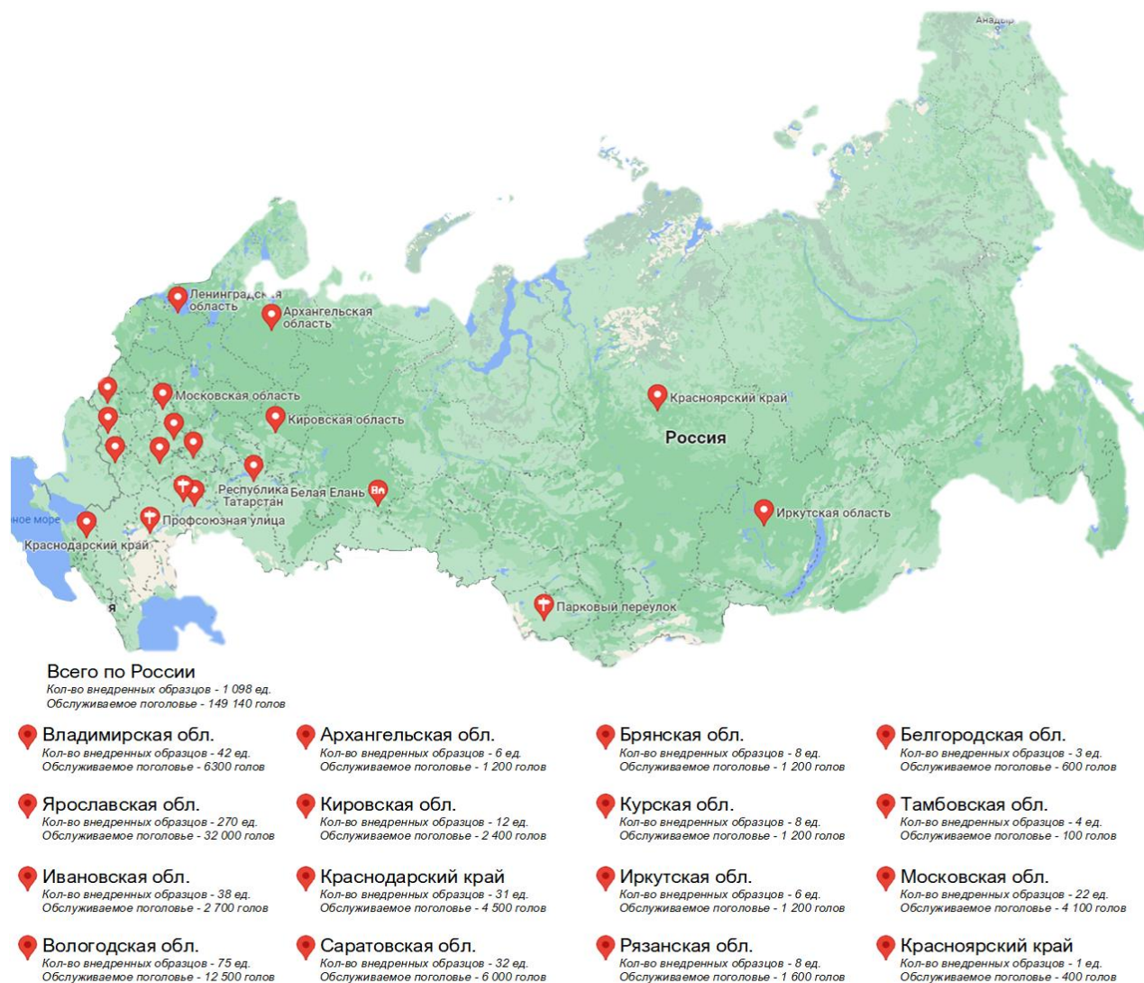
Рисунок 1. География внедрения

регионах РФ: республике Мордовия, Татарстан; Московской, Ярославской, Владимирской, Рязанской, Калужской, Тамбовской областях (рис. 1).